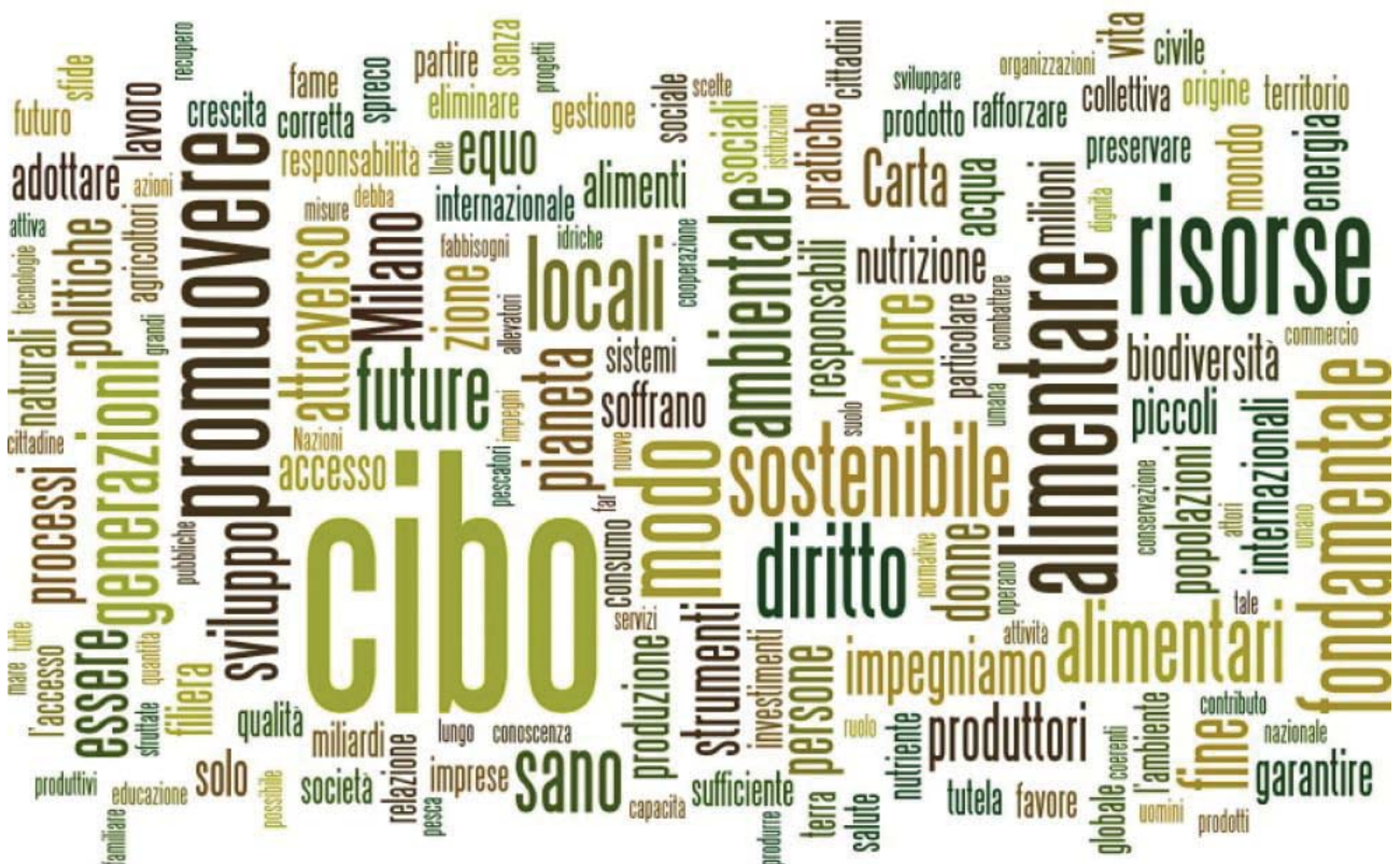
Sintesi grafica della tematica di Expo Milano

gli operatori e i ricercatori del settore alimentare il Santo Padre si augura che "il Signore conceda loro saggezza e coraggio" e che questa esperienza permetta agli imprenditori, ai commercianti e agli studiosi di sentirsi coinvolti in un grande progetto di solidarietà: "Nutrire il pianeta nel rispetto di ogni uomo e donna e nel rispetto dell'ambiente naturale. Ai cristiani ricorda la preghiera per eccellenza - il Padre nostro - nella quale Gesù insegna: "Dacci oggi il nostro pane quotidiano". ■