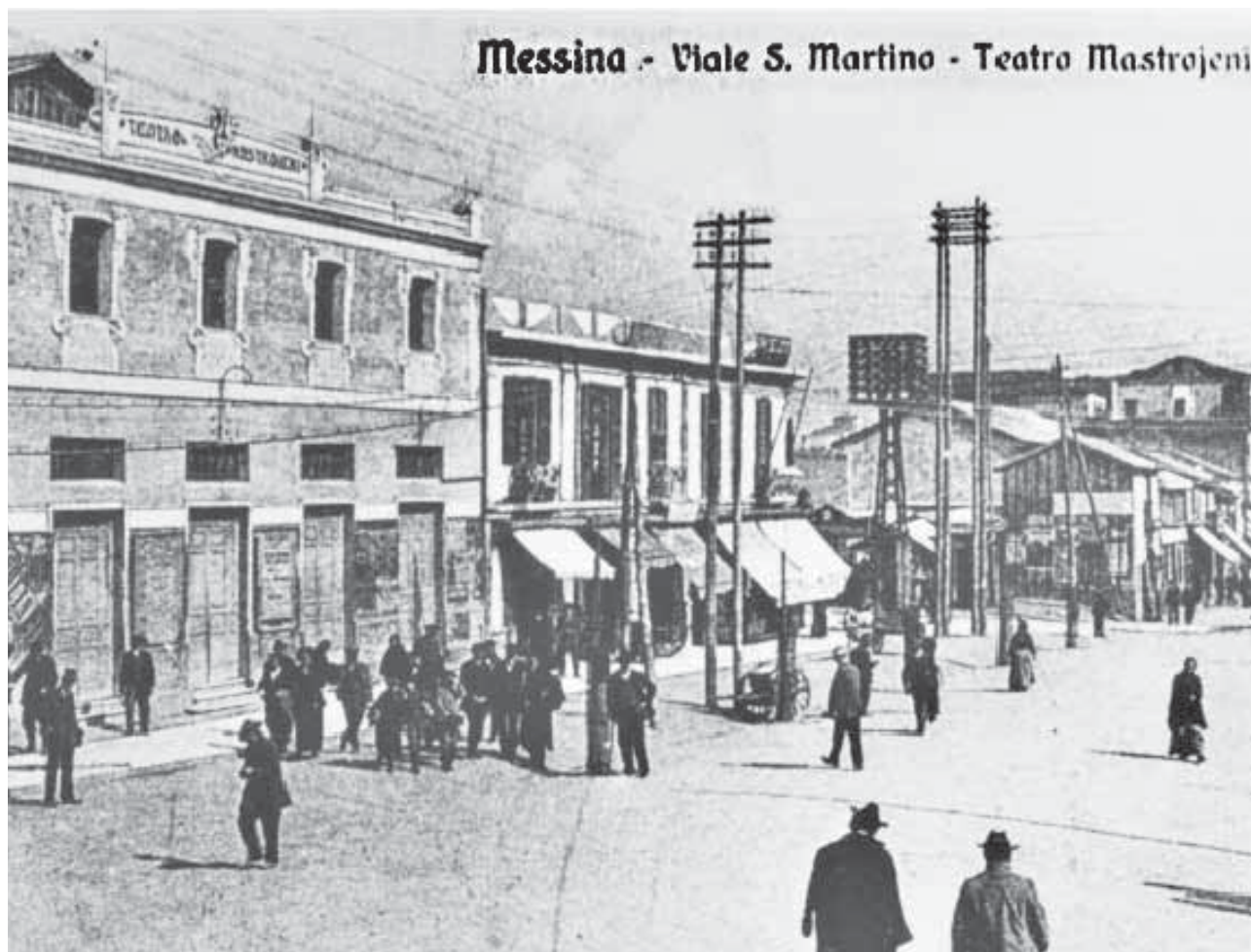
Il Teatro Mastrojeni in una foto d'epoca

T ito Schipa esordì a Messina il 9 luglio del 1910 al Teatro Mastrojeni nella Traviata di Verdi insieme con il soprano Claudia Muzio, anch'essa esordiente. Si narra che il doppio esordio fu dovuto all'impertinenza di un tenore che durante le prove del secondo atto, rivolgendosi al soprano, invece di attenersi al testo " Lungi da lei per me non v'ha diletto " esternò parafrasando: " Senza di lei stasera non vò a letto ", suscitando l'istantanea reazione della madre della Muzio che minacciò di far ritirare la figlia se il tenore non fosse stato sostituito. Così l'impresario chiamò Tito Schipa a ricoprire il ruolo di Alfredo.